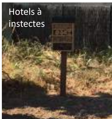
Hotels à insectes

Réalisation des mesures d'accompagnement sur l'ensemble du tracé