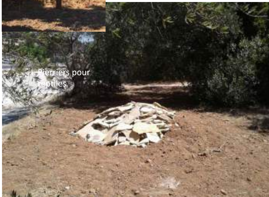
Pierriers pour reptiles