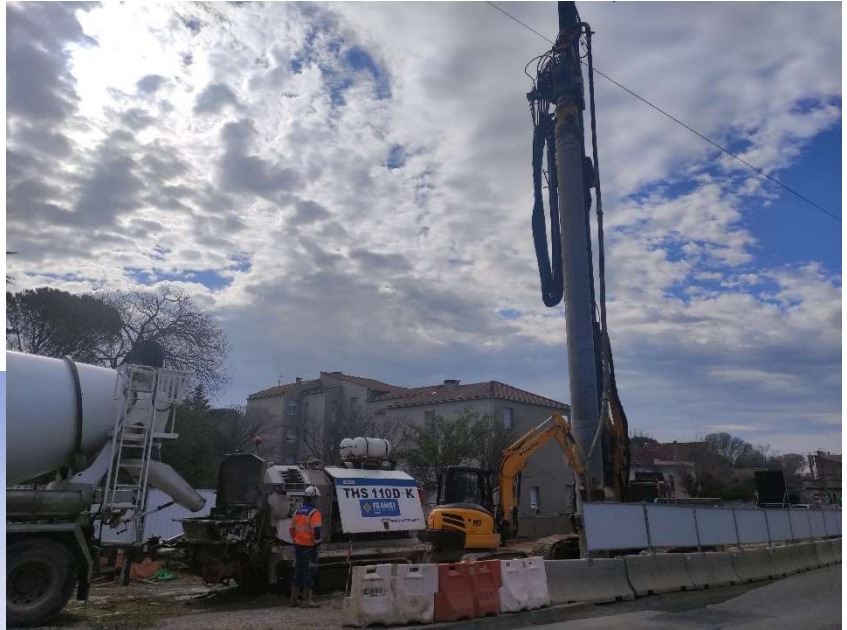
Photo du 18/03/2024 Atelier de forage et bétonnage de pieux