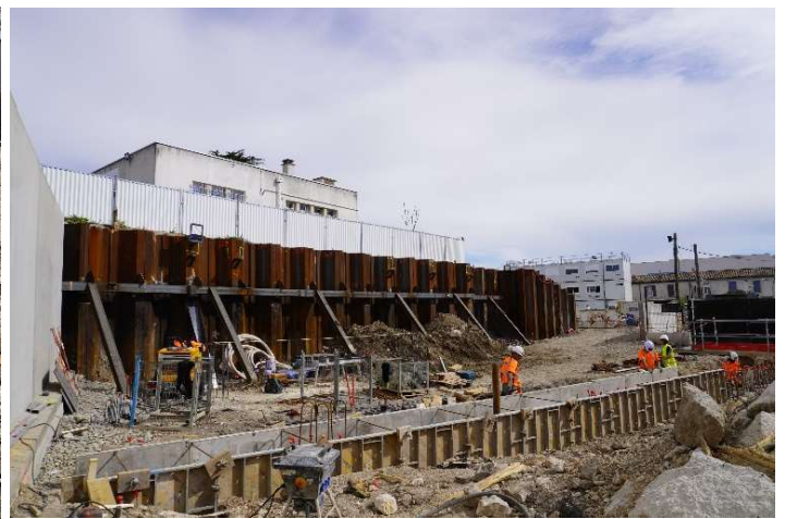
Photo du 08/03/2024 et 16/03/2024 Réalisation de la poutre de couronnement