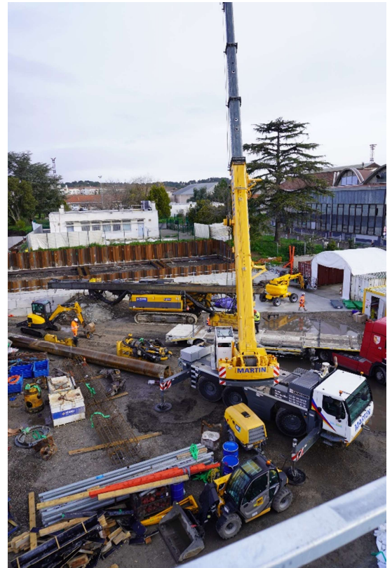
Photo du 07/03/2024 Départ Atelier pieux