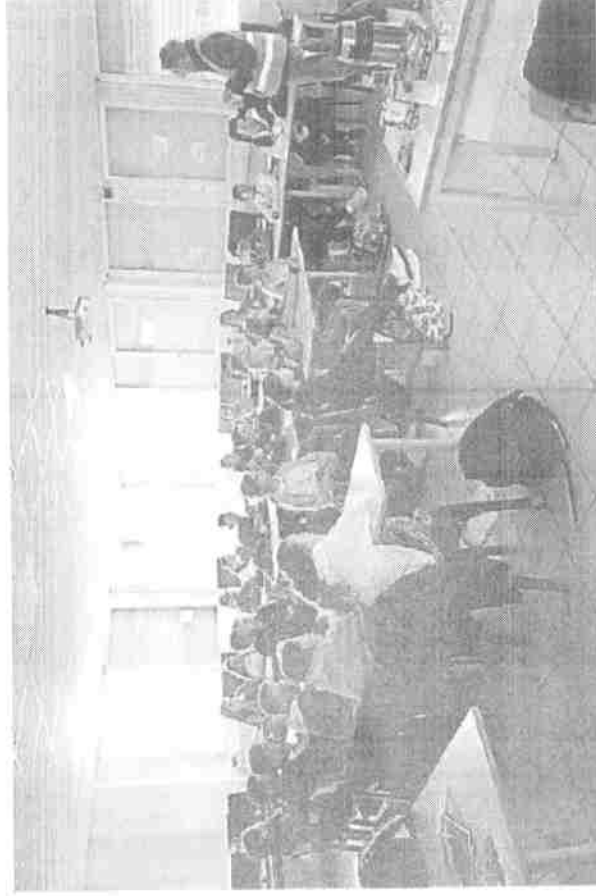
Les élèves en formation théorique.

L'animateur poursuit : « Nous leur indiquons aussi la sécurité dans et autour du car : l'attitude à la montée et à la descente, l'obligation du port de la ceinture et les comportements à avoir, en cas d'accident ou de feu, pour effectuer ces trajets en toute sécurité. » Le président continue : « À l'issue, nous passons aux ateliers pratiques avec un car qui nous est mis à disposition par un transporteur. Trois thèmes sont deve-