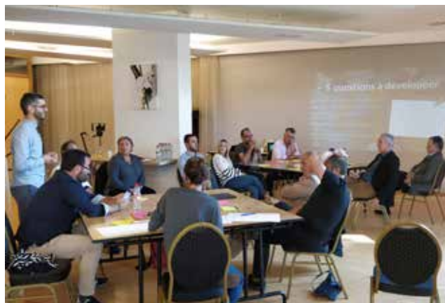
Atelier de concertation des chefs d'entreprises

Mis en ligne en janvier 2023, le nouveau site web de Nîmes Métropole offre une vraie « porte d'entrée » territoriale aux entreprises et porteurs de projets. Simple et lisible, conçu en partenariat avec les acteurs économiques, il rassemble toute l'information sur les services d'accompagnement et compile des outils de contact efficaces, sans oublier de mettre en avant les atouts du territoire.