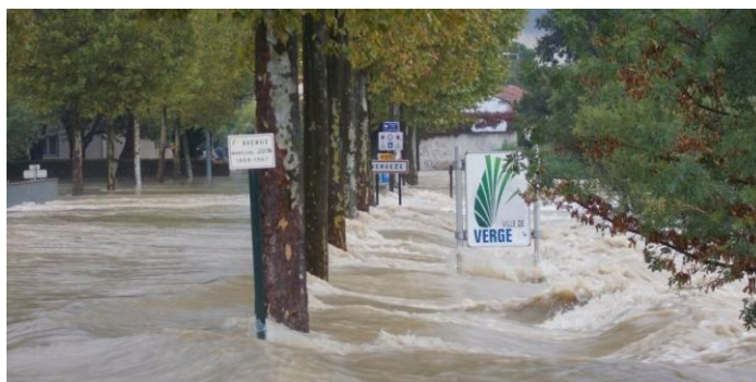
Illustrations des typologies d'inondations du territoire :

A gauche : cadereau d'Uzès en zone urbaine (quartier SERNAM – Richelieu) – 03 oct. 1988