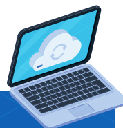
Table ronde I Le piratage : conséquences pour les entreprises