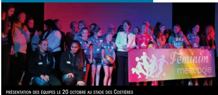
PRÉSENTATION DES ÉQUIPES LE 20 OCTOBRE AU STADE DES COSTIÈRES