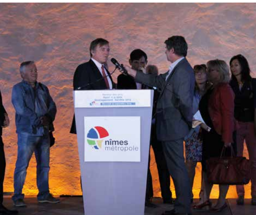
REMISE DES PRIX DE L'APPEL À PROJETS DÉVELOPPEMENT DURABLE 2015

L'association Point ressources services aux particuliers du Gard (7 400 € de subvention) œuvre de son côté pour la mise en place d'un nouveau service de conciergerie à l'échelle d'un territoire. La commune de Saint-Chaptes utilisera par ailleurs les 3 000 € reçus pour la création de jardins familiaux dans le respect de l'environnement et du vivre-ensemble. Quant à l'association Autour de la vie , elle mettra à profit les 3 000 € reçus pour un compost collectif à la disposition du jardin collectif rue de Rivoli. Enfin, l'École de l'ADN de Nîmes travaille, grâce à sa subvention de 1 000 €, sur un nouvel outil pédagogique sur l'évolution des plantes, en direction des 7-18 ans.