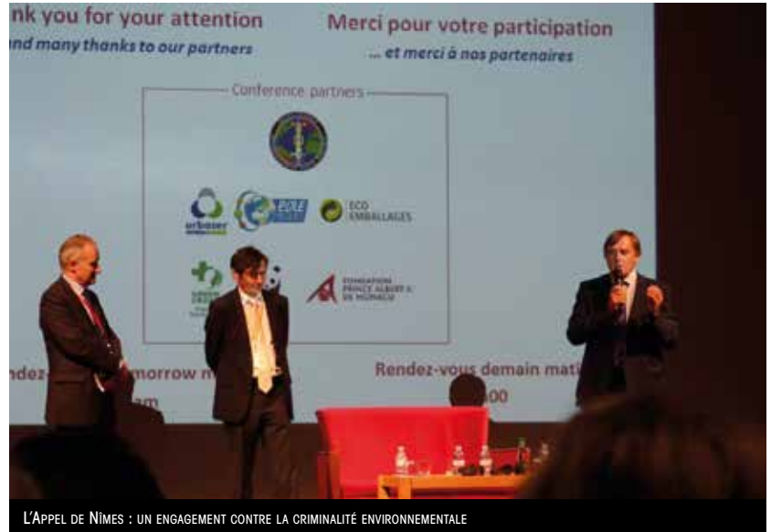
L'APPEL DE NÎMES : UN ENGAGEMENT CONTRE LA CRIMINALITÉ ENVIRONNEMENTALE

Pour que les mots ne restent pas vains, cette conférence a été à l'origine de l'Appel de Nîmes pour la lutte contre la criminalité environnementale : un engagement de tous les acteurs pour adopter des mesures autour de 5 axes prioritaires. « L'objectif de l'Appel de Nîmes a été de fédérer les propositions des intervenants autour de plusieurs axes prioritaires qui visent à renforcer la prévention, intensifier la répression, améliorer la réparation des préjudices, ou poursuivre les efforts de coordination internationale. Cet Appel représente un acte de naissance au service du suivi de cette réalité criminelle », complète Laurent Neyret. Pour le Président Yvan Lachaud, l'enjeu de cet Appel de Nîmes est considérable. « On ne peut plus laisser les choses en l'état. Il est essentiel que les élus prennent des décisions fortes, légifèrent dans ce domaine. Nîmes Métropole s'inscrit ainsi durablement dans la lutte contre la criminalité environnementale et pour un développement durable. »