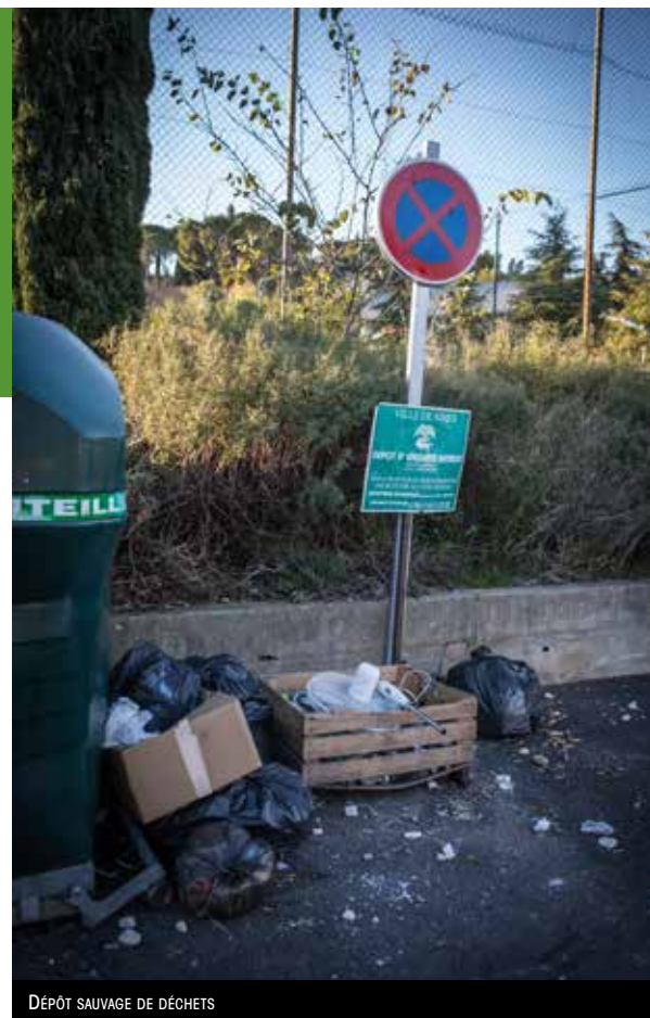
DÉPÔT SAUVAGE DE DÉCHETS