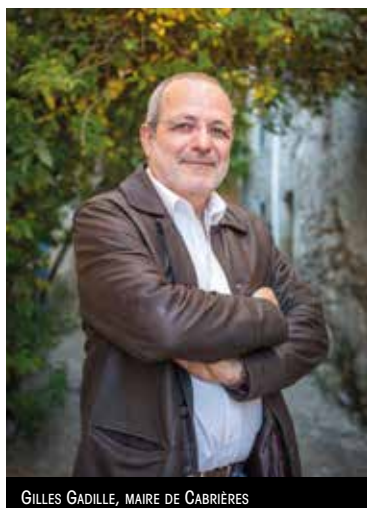
GILLES GADILLE, MAIRE DE CABRIÈRES

La maîtrise de l'urbanisation et de la démographie de Cabrières s'inscrit dans le cadre de la mise en place du plan local d'urbanisme en 2005, modifié en 2011 : « À la fin de mon mandat, notre but est de maintenir notre population à un nombre avoisinant 1 700 habitants. » Dans un contexte de baisse des dotations de l'État, plusieurs réalisations sont toutefois à l'ordre du jour : extension de l'école avec deux classes supplémentaires pour anticiper l'augmentation de la population, enfouissement des réseaux téléphoniques et électriques pour rendre au paysage sa valeur initiale, aménagement de l'entrée de ville après l'été 2016-2017, création d'un poumon vert de deux hectares avec une aire de jeux et un espace santé ou encore transformation de l'ancien presbytère pour mettre à disposition un logement social.