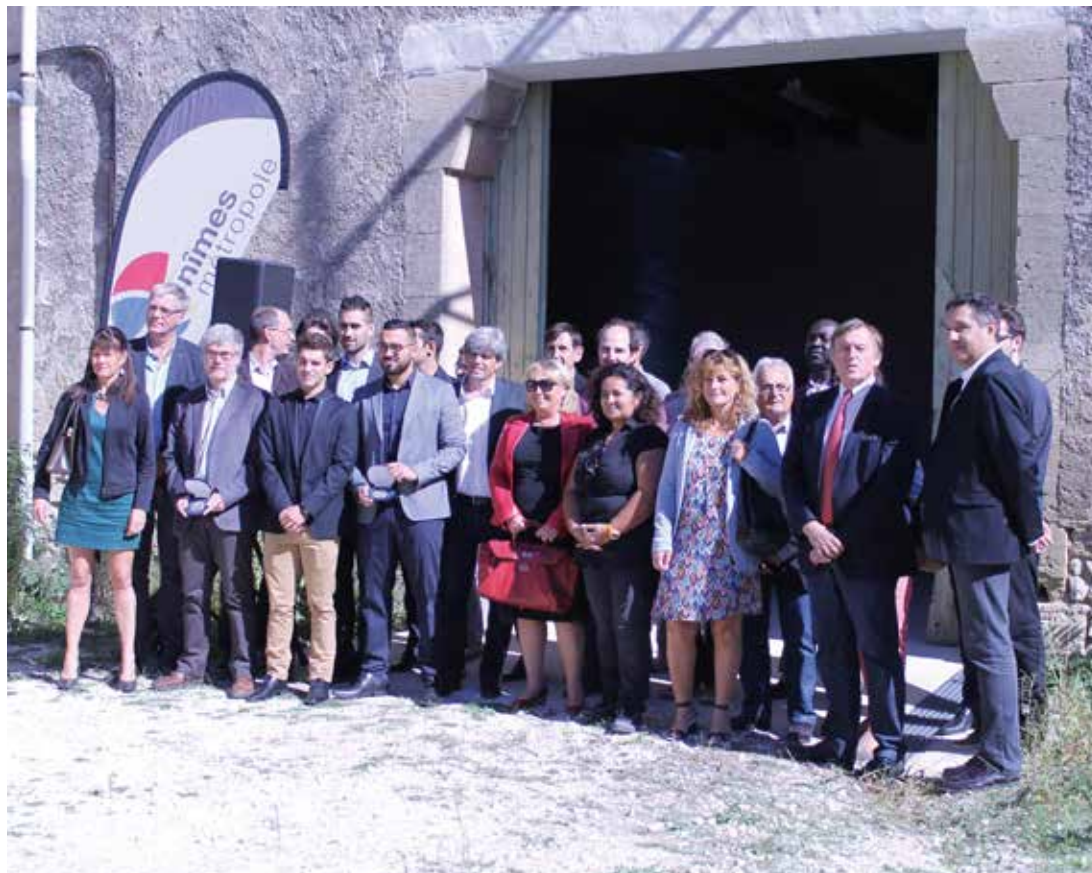
LES LAURÉATS 2015

CETTE ANNÉE, L'AGGLOMÉRATION A RÉCOMPENSÉ 11 PROJETS DANS LE CADRE DE SON SOUTIEN AUX INITIATIVES DE DÉVELOPPEMENT DURABLE. PRÉSENTATION DU DISPOSITIF ET DES LAURÉATS DONT LES PROJETS PORTENT HAUT LES VALEURS DU VIVRE-ENSEMBLE ET DE LA SOLIDARITÉ.