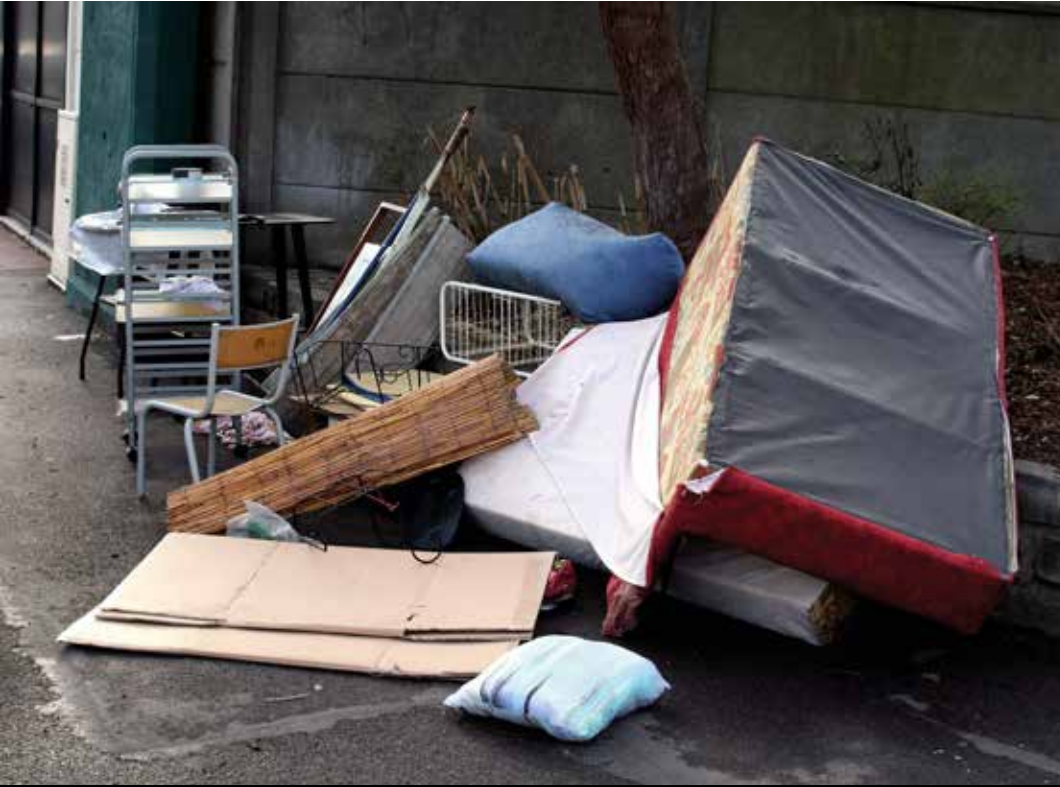
LES RUES TRANSFORMÉES EN POUBELLE À CAUSE DU DÉPÔT SAUVAGE DE DÉCHETS