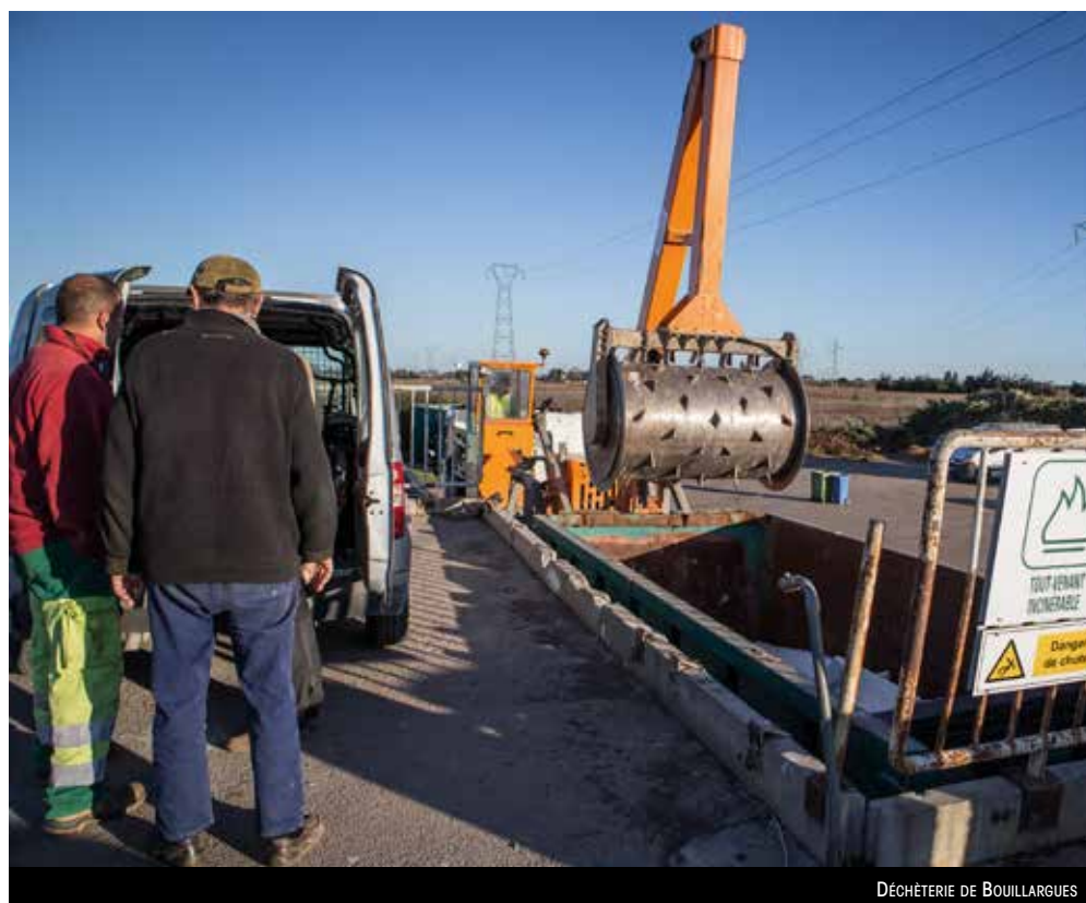
DÉCHÈTERIE DE BOUILLARGUES

À l'heure actuelle, 70 % des déchets déposés en déchèterie sont valorisés soit par recyclage, soit par valorisation énergétique, mais ce chiffre peut encore être amélioré. Les déchets ne pouvant pas faire l'objet d'une valorisation correspondent en majorité aux encombrants non incinérables qui sont orientés vers le stockage.